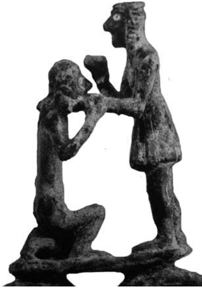
Fig. 3. Particolare del passabriglie (da Dussaud 1932, 229, fig. 2).