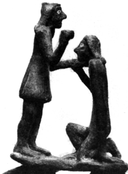
Fig. 4. Particolare del passabriglie (da Dussaud 1932, 229, fig. 3).